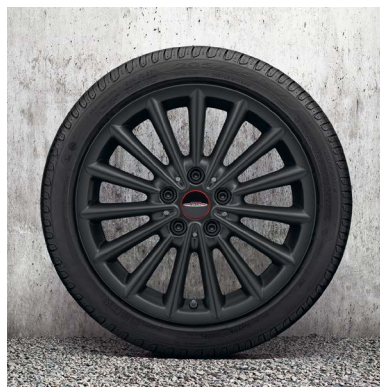
17" JCW MULTI SPOKE 505.