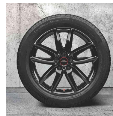
18" JCW GRIP SPOKE 815.