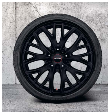
18" JCW CROSS SPOKE 506.