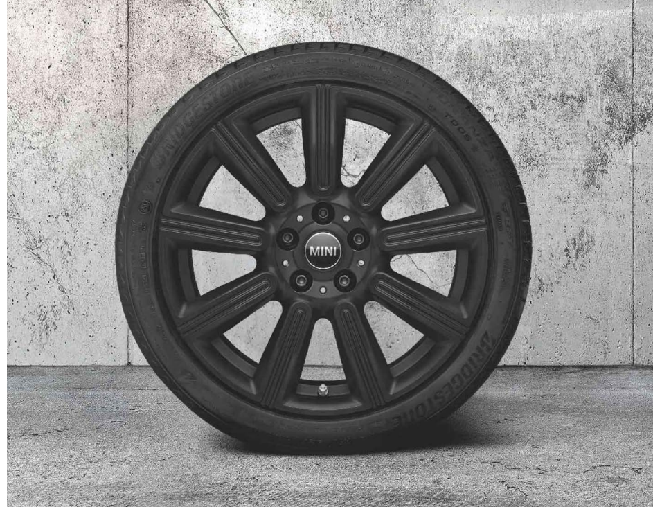
18" MINI MULTIRAY SPOKE 591.

☼ Pneu étoilé ⚡ Capteurs de surveillance de pression 🛞 Roulage à plat